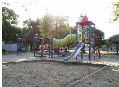
公園 柏原公園まで785m

《 周辺の環境 》 春日井市立柏原小学校まで680m 春日井市立柏原中学校まで929m 清水屋春日井店まで1134m イオン春日井店まで917m アオキスーパー朝宮店まで1000m V・drug春日井朝宮店まで988m