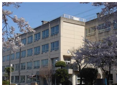
中学校 春日井市立柏原中学校まで929m